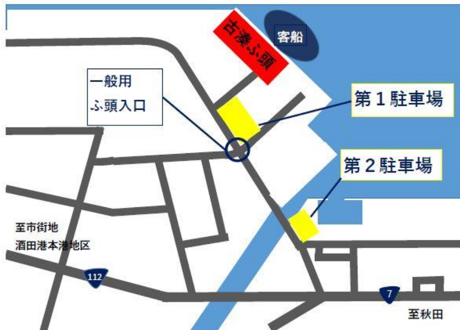
一般用ふ頭入口拡大図

お車でお越しの方は、酒田北港古湊ふ頭内の第1駐車場、または第2駐車場をご利用ください。